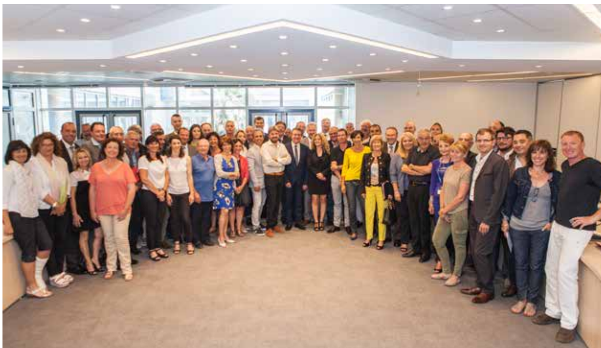
Le Conseil est composé de 107 membres (titulaires et suppléants)